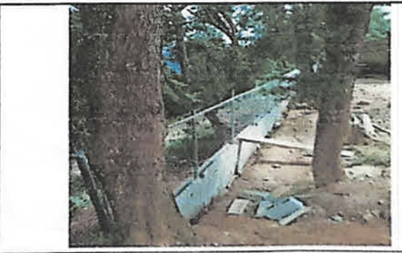
Foto 6: Después del levantado de block entre las columnas fundidas se continuó con la colocación de la malla galvanizada con sus postes y travesaños superiores.

Observación: Si es necesario se pueden agregar hojas adicionales y actualizar el número de hojas.