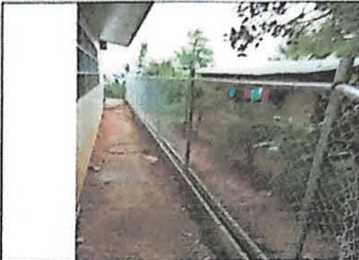
Foto 2: Se colocó la malla tensada dentro de la solera tipo U fijada a la varilla de hierro de 3/8" y hacia la parte posterior al travesaño de tubo de 1 1/2" para la posterior fundición de la solera con la malla adentro.