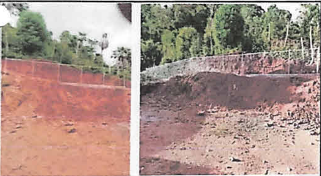
Foto 3: Se electrosoldó el travesaño en la parte posterior a los tubos de postes que están fundidos desde el cemento y luego se tensó la malla en ambos sentidos.