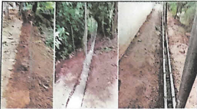
Foto 1: En la circulación perimetral se realizó zanqueo, fundición de cemento, colocación de block, dejando los postes de tubo galvanizados fundidos desde la cimentación hasta la solera en U