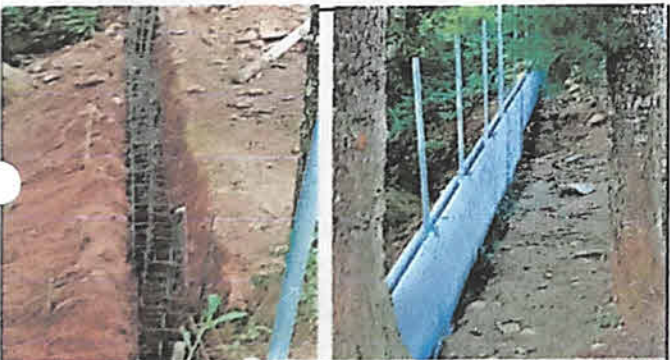
Foto 5: Para evitar el derrumbamiento del terreno se construyó el muro de contención con columnas fundidas con concreto y armadura de hierro legitimo.